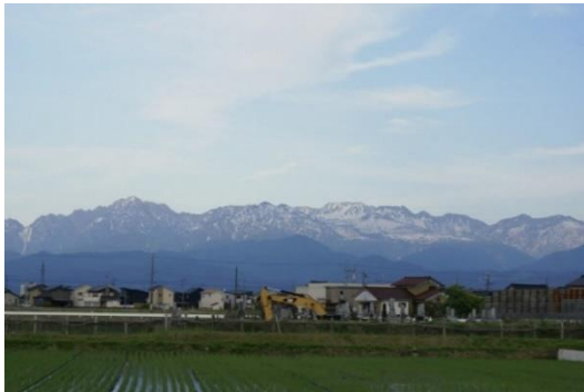
いえ ちか たてやま連峰 家の近くから立山連峰 ○月○日