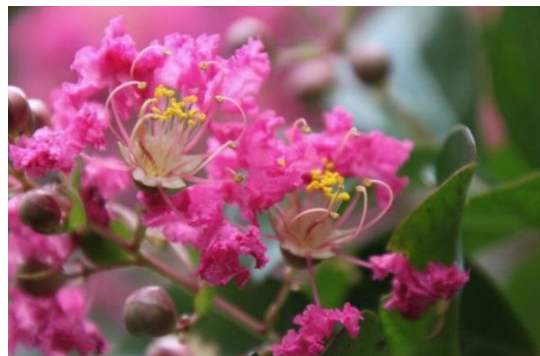
いえ にわ 家の庭のサルスベリ ○月○日