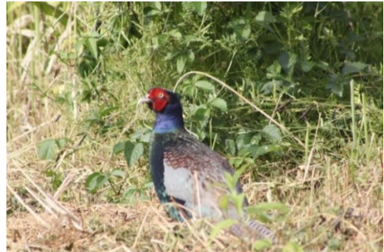
キジ きんじよ あち 近所の空き地で ○月○日