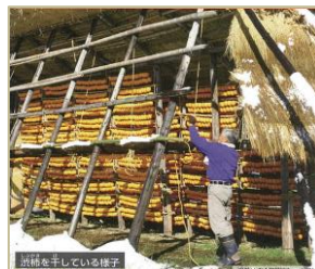
渋柿を干している様子

天日干し、またはかんそう 機械乾燥機を使っ て、約20～25日間かけて、ゆっくりと 乾燥させる。