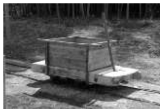
工事用のトロッコ

みかん畑の間を登りつめると、急に線路は下りになった。しまのシャツを着ている男は、良平に「やい、乗れ。」と言った。良平はすぐに飛び乗った。トロッコは三人が乗り移ると同時に、みかん畑の匂 にお いをおりながら、ひた滑りに線路を走りだした。「押すよりも乗るほうがずっといい。」——良平